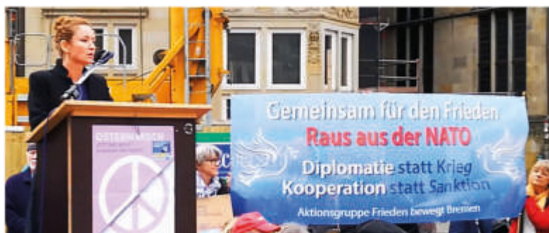
Ostermarsch Kundgebung 2024 auf dem Bremer Marktplatz mit Zaklin Nastic