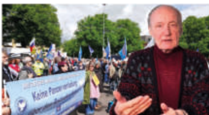
Eugen Drewermann Audio-Grußwort. Eugen Drewermann ist ein international bekannter Friedensaktivist, Autor, Redner und Kirchenkritiker